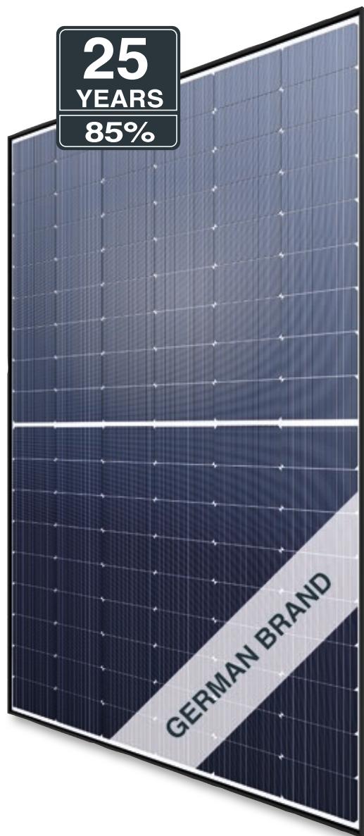
Abb. ähnlich 108MHDE21109A

Hochwertige Anschlussdose und Steckersysteme