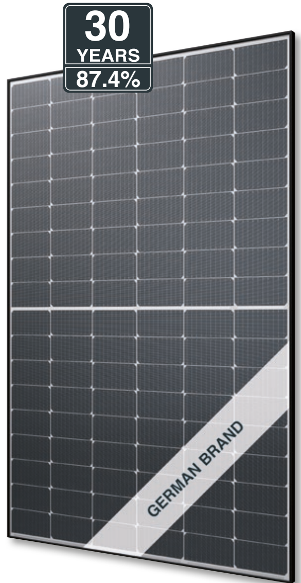
Abb. ähnlich 108TFMDE240418A